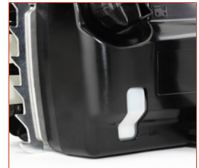
Sichtfenster für Ölstandskontrolle